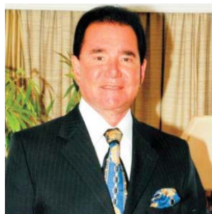
Sócio do Iate há mais de 40 anos