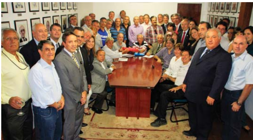
Momento do pedido de registro da chapa "IATE É VOCÊ" perante à Comissão Eleitoral