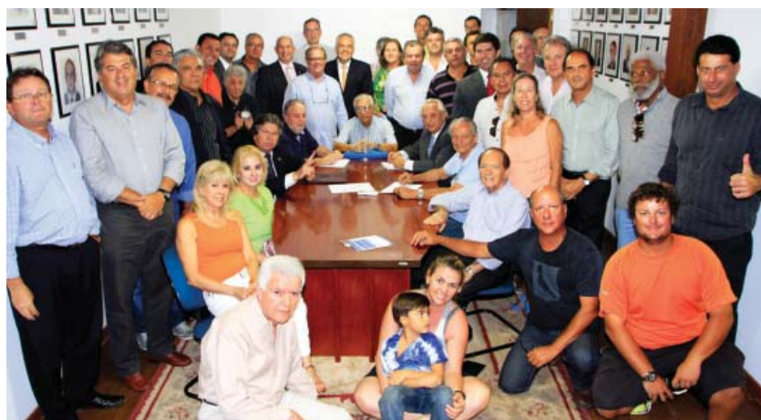
Momento do pedido de registro da chapa "RUMO CERTO" perante à Comissão Eleitoral