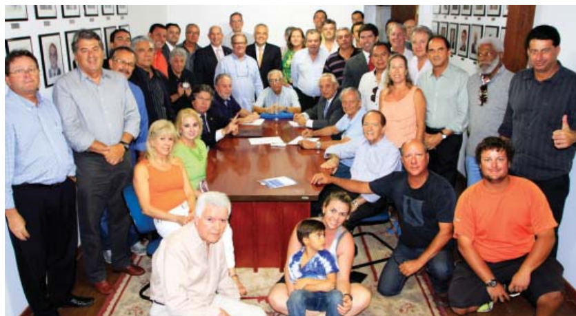
Momento do pedido de registro da chapa "RUMO CERTO" perante à Comissão Eleitoral