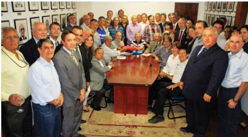
Momento do pedido de registro da chapa "IATE É VOCÊ" perante à Comissão Eleitoral